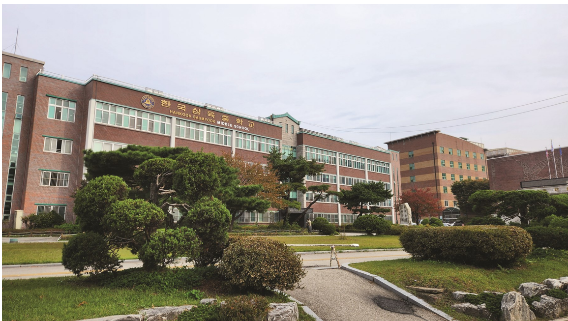
Hankook Sahmyook Academy i Seoul, Sør-Korea.

Du kan laste ned et misjonskart med prosjektene påført, på Facebook, her: bit.ly/fb-mq .